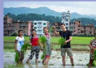
Community Homestay Network in Nepal