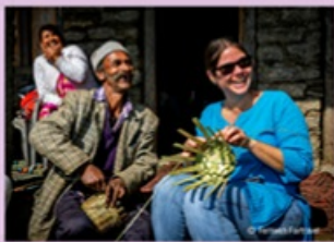
Fernweh Fairtravel in India