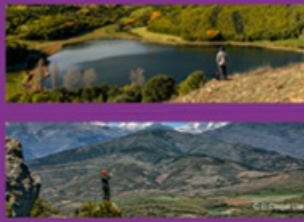
El Cinquè Llac in Spain