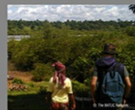
The BATUC Network in Brazil