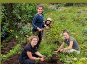
Community Tourism Yunguilla in Ecuador