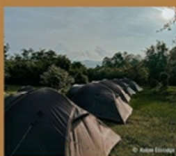
Kalsee Ecolodge in Nepal